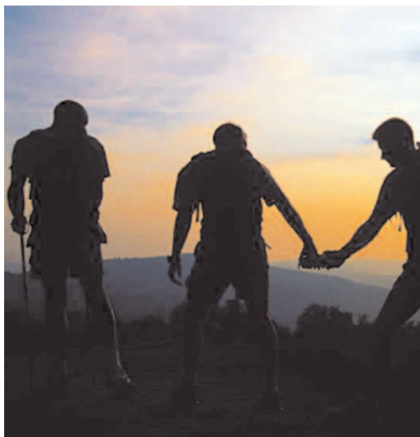
Randonnée gourmande étoilée