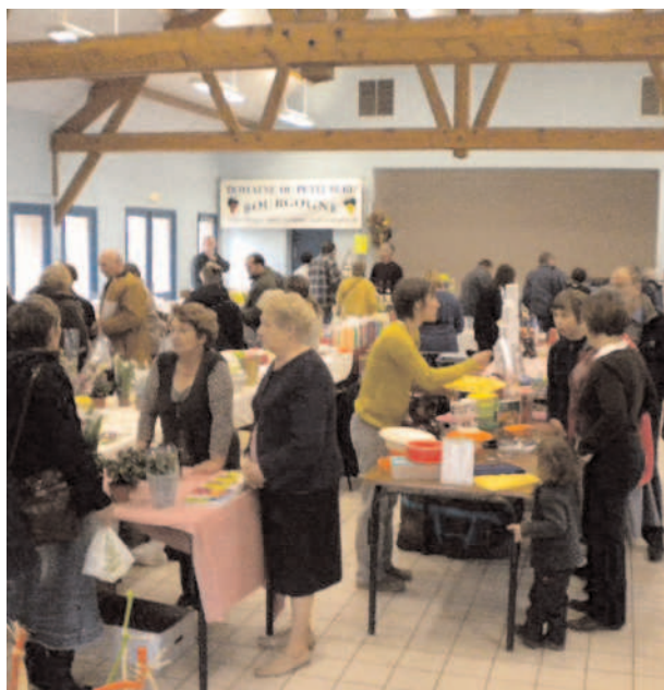
Marché de Printemps