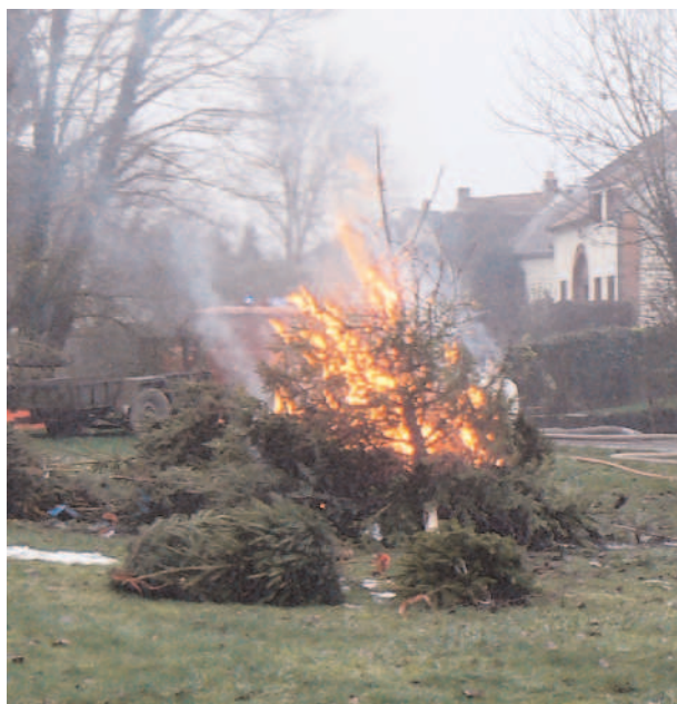
Feu de joie des sapins de Noël