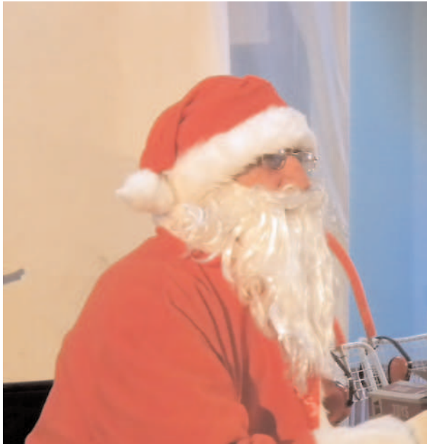
Spectacle de Noël des enfants de la commune