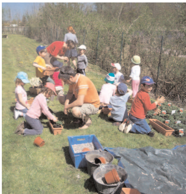
Après-midi "nature" de la Fête Patronale