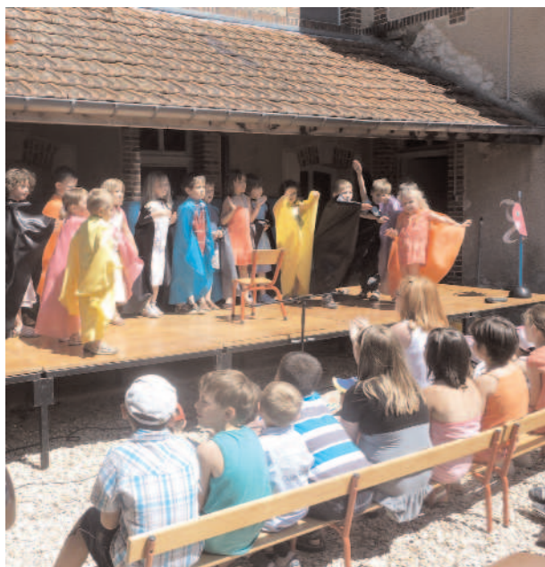
Kermesse des écoles