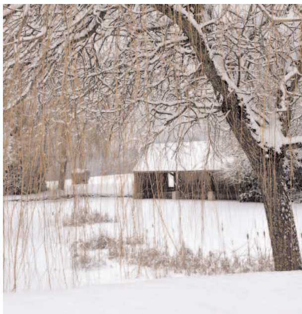
Lavoir du Fays sous la neige