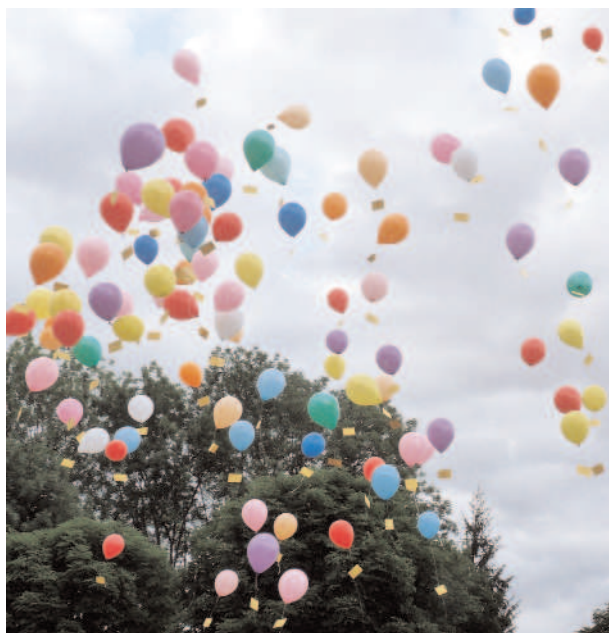
Lâcher de ballons du 14 juillet