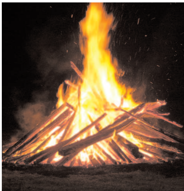
Feu de Saint Jean