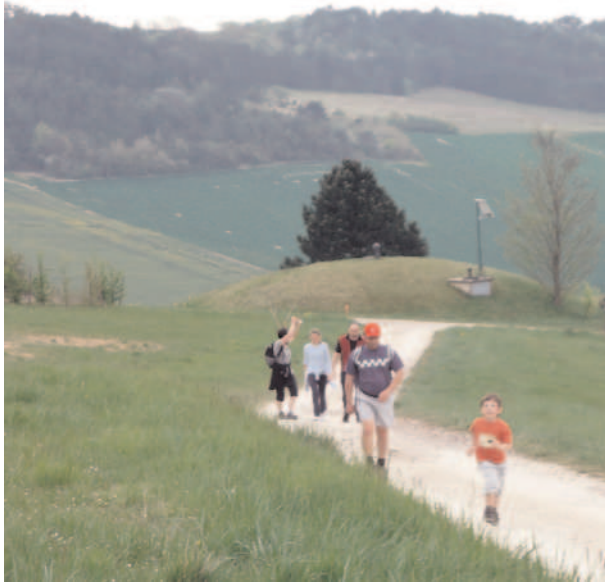
Marche de l'Association sportive de Turny