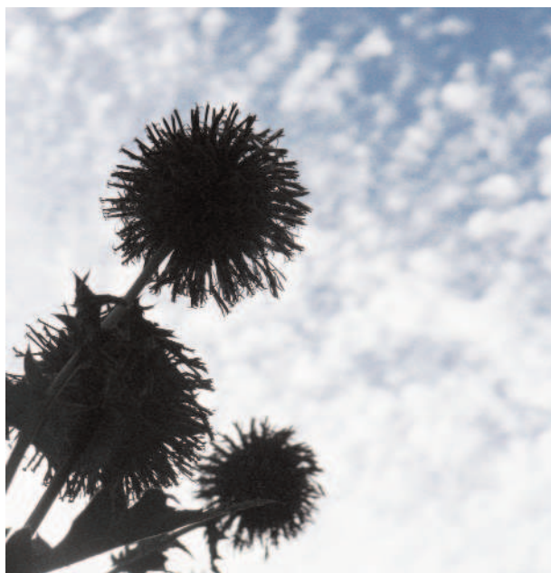
Cliché nature de Turny