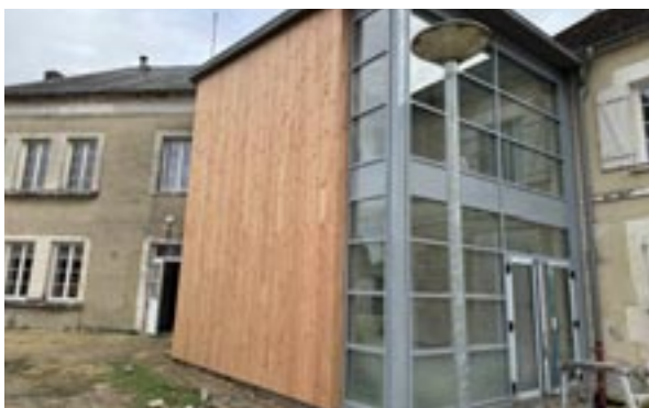
Extension Accueil Mairie