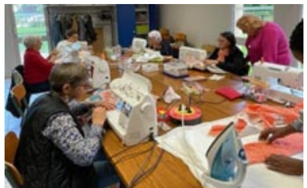
Les rendez-vous A Tous Points du samedi