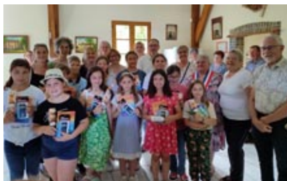
Les CM2 du RPI lors de la remise des calculatrices à Cerilly