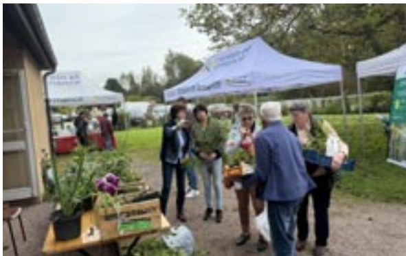
Troc aux graines et aux plantes

L'originalité de ce troc a même valu à Turny la visite d'une journaliste de France Bleu Auxerre venue interviewer les uns et les autres sur la particulière attention de notre commune à la préservation de la diversité et à la bonne ambiance qui y régnait !