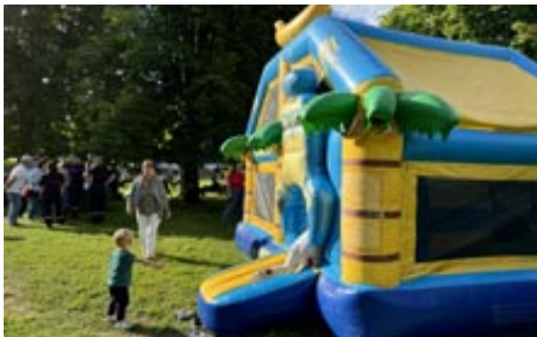
Structure gonflable pour les enfants au 14 juillet