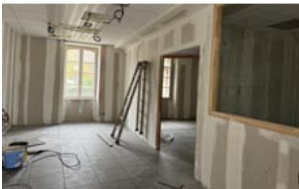
Futurs Accueil secrétariat Mairie et bureau du Maire

Les travaux continuent... les bureaux de la mairie seront sans doute livrés fin novembre.