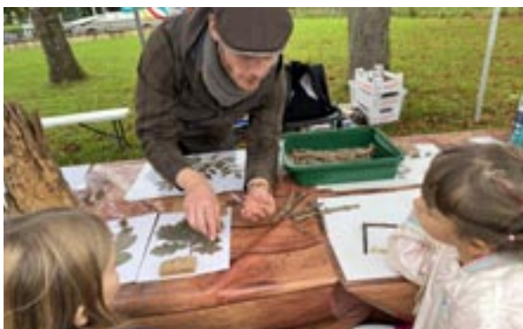
Animation autour des feuillages par la Maison de la Nature de Migennes