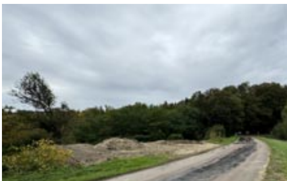
Dépôt de terre face à la plateforme du Fays