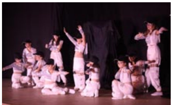
Le 2 e groupe des Grandes