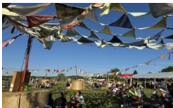
La Grand Hâte, théâtre en plein air