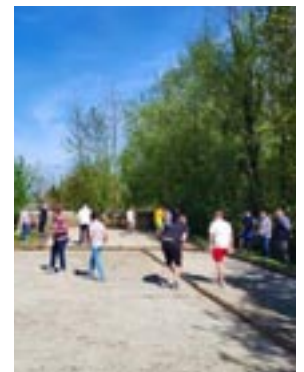
Ateliers du 14 juillet 2024