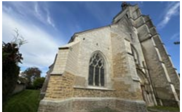
Les deux contreforts rénovés de l'église

Vos dons ayant atteint l'objectif souhaité de 9 000 € et avec l'obtention de l'aide de la DRAC (40%) et d'une subvention du Conseil départemental de 16 592 €, nous avons pu lancer les travaux qui sont terminés. Ils ont coûté 49 777 € et laissent apparaître un enduit qui, au fil du temps, va retrouver les couleurs de celui des murs.