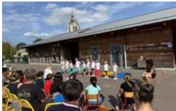
Spectacle des maternelles

La kermesse des écoles de Turny a eu lieu le vendredi 28 juin à partir de 17h30 dans la cour de l'école de la Brumance, jour, heure et lieu qui semblent satisfaire tout un chacun.