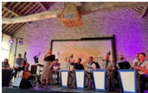
Concert jazz à la Grange de Beauvais

• Cet été, nos sorties en covoiturage nous ont menés d'un concert de jazz à la grange de Beauvais à la Cité du vitrail à Troyes en passant par le château de Maulnes et le festival de théâtre en plein air de la Grande Hâte. C'est cette dernière sortie qui a rassemblé le plus de monde. Il faut dire que c'est un vrai plaisir de voir cette troupe de jeunes professionnels qui présente des textes classiques adaptés dans des mises en scène ébouriffées ! De 7 à 77 ans (et plus), on rit, on s'émeut, on en prend plein les yeux, installés sur des bottes de paille dans un champ éclairé d'un magnifique coucher de soleil. On vous proposera à nouveau cette sortie l'année prochaine, ne la ratez pas !