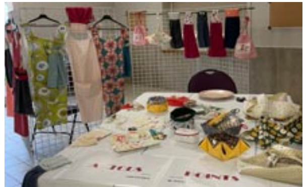
A Tous Points au 2 e Marché d'automne