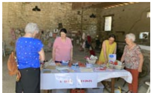
Participation d'A Tous Points au Sentier des Arts