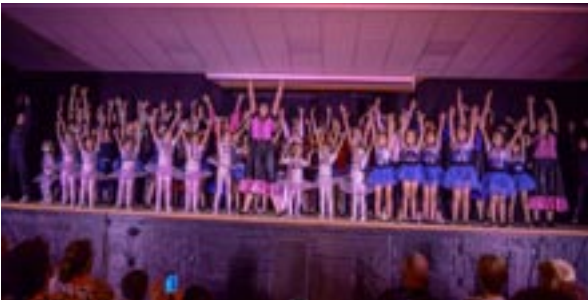
Le final du spectacle