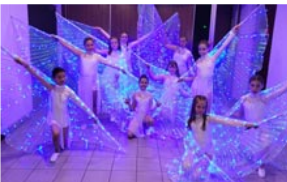
Le 1 er groupe des Grandes