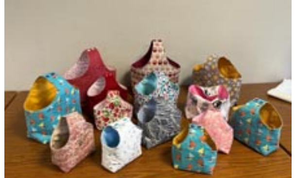
Les réalisations d'A Tous Points

Si certains d'entre vous souhaitent rejoindre ce groupe de participantes qui se retrouvent dans la bonne humeur, n'hésitez pas à contacter la mairie qui vous transmettra les coordonnées des membres du bureau.