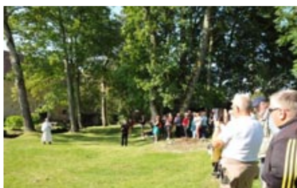
Saynette, les Templiers à LInant