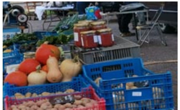
Petit Marché du jeudi à Turny durant l'été