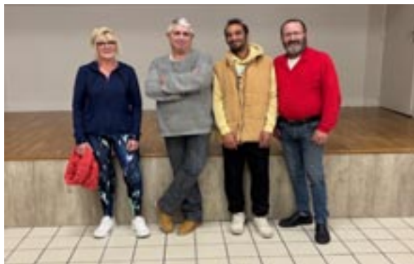
Une partie de La Cie du Parapluie autour de son président