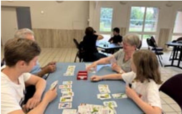
Jeux sur l'herbe ... 23 juillet 2024