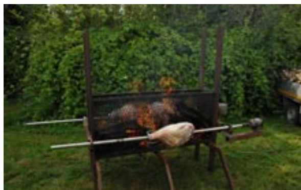
Pendant la cuisson des jambons à la broche

Le samedi 31 août 2024, nous avons réuni près d'une centaine de convives pour notre repas champêtre, avec comme star le célèbre jambon à la broche, dans une ambiance détendue et festive.