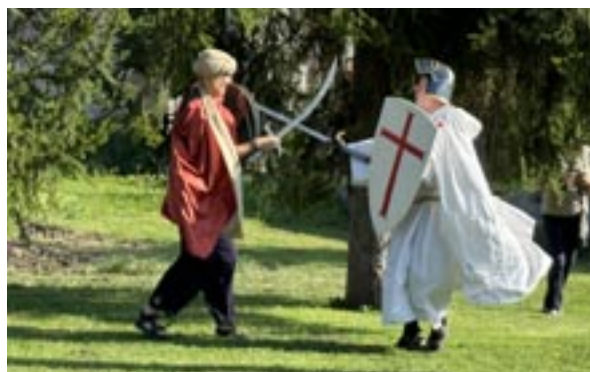
Combat Sarrasin et Templier à l'Hôpital