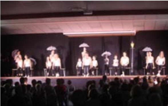
L'entrée du spectacle