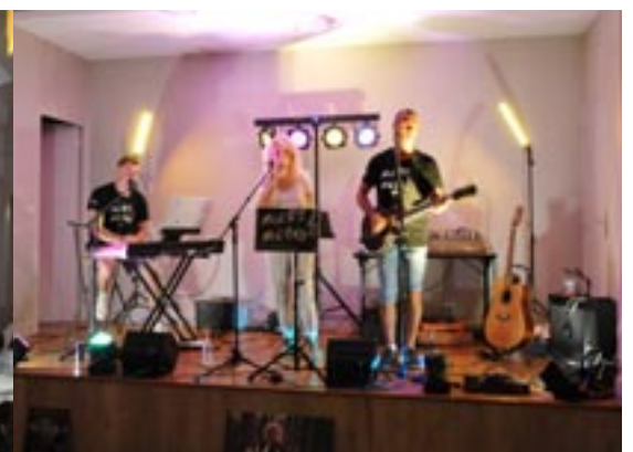
31 août 2024 Repas champêtre organisé par Turny Animation avec le groupe Mist'Rs Melody