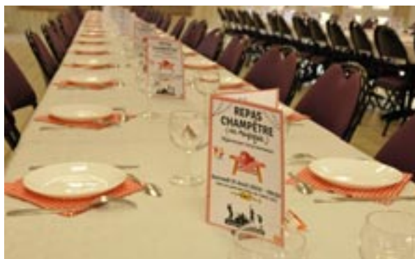
Le repas champêtre attend ses convives