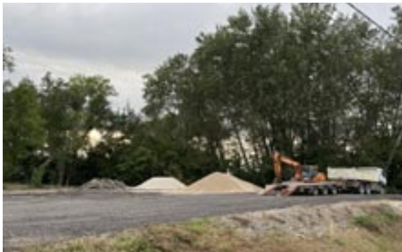
Future zone de stockage de la commune à Bas-Turny