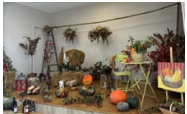
Le fameux décor du Marché d'automne réalisé par les bénévoles de Turny Animation Nature

Les animations ont rencontré un franc succès, que ce soit le tournage du bois, la fabrication de la peinture à l'ocre, les vieux tracteurs ou encore les maquettes de charpentes des Compagnons du devoir. L'atelier d'initiation à la Vannerie et c e l u i d'initiation