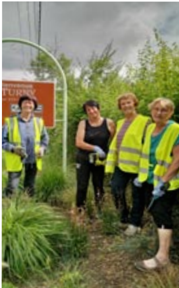
L'équipe du fleurissement

C'est dans la bonne humeur et toujours avec plaisir que l'équipe de Turny Animation Nature composée de sept personnes, se retrouve régulièrement tout au long de l'année, pour fleurir différents endroits de la commune.