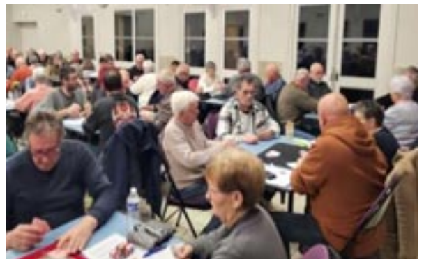
Concours de belote annuel de Turny Pétanque