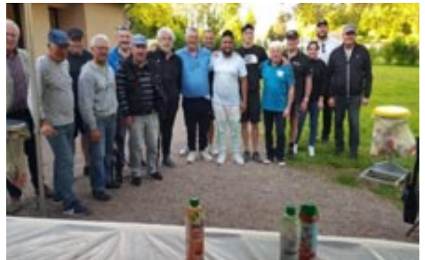
Les vendredis de Turny Pétanque