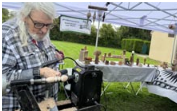
Tournage du bois