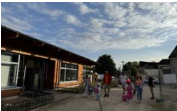
Jour de rentrée à Turny le 2 septembre 2024

Selon les directrices d'écoles, la rentrée s'est bien déroulée et les effectifs des classes sont adaptés pour un travail suivi des élèves. Il a fallu un peu adapter les horaires d'entrée et de sortie de l'école de Turny, comme ceux de la pause méridienne, afin de permettre la coordination des transports scolaires, mais cela ne pose aucun problème aux enseignantes, ni aux parents.