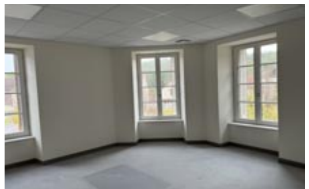
Salle de travail et réunion des commissions communales