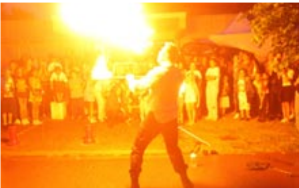
le cracheur de feu