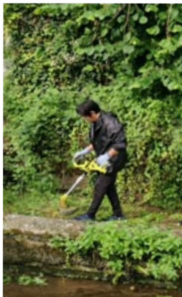
Nettoyage de la végétation du lavoir de la Rue des Canes

De nouvelles fleurs et plantes offertes par les adhérents ont été plantées dans les massifs. La taille des arbustes et des plantes a été effectuée pour favoriser une croissance saine et harmonieuse.