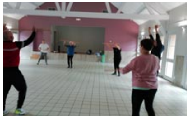
Association sportive : cours de gym du jeudi matin

Il reste encore des places dans chacun de nos cours, n'hésitez pas à venir tester, le cours d'essai est offert !