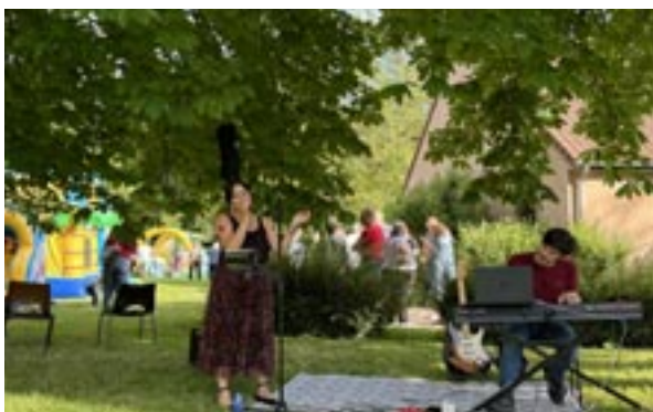
Concert du groupe Velvet Anacrouse

Cette année les festivités à Turny se sont déroulées le 13 juillet 2024.